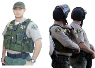
Local Sheriffs (سيمه ييز شريفز)