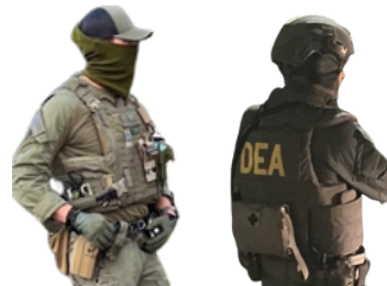
U.S. Drug Enforcement Administration (DEA-د امریکا د مخدره توکو د تطبيق اداره)

مهرباني وکړئ خپل معلومات له مور سره شريک کړئ او خوندي پاتې شئ! د مرستې لپاره AMAC ته زنگ ووهئ: (615)889-0646