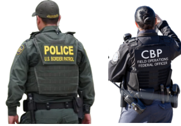
U.S. Customs and Border Protection (CBP-د امریکا د گمرکاتو او سرحدي ساتنې اداره)