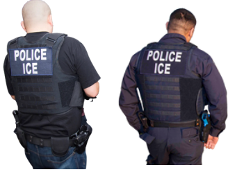
U.S. Immigration and Customs Enforcement د امریکا د کډوالۍ (ICE- او گمرکاتو پلي کولو اداره)