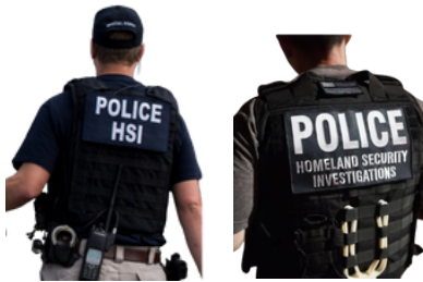
Homeland Security Investigations (HSI-د کورني امنيت تحقيقات)