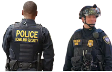
Department of Homeland Security (DHS-د کورني امنيت وزارت)